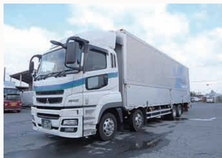
全車エアサス車両